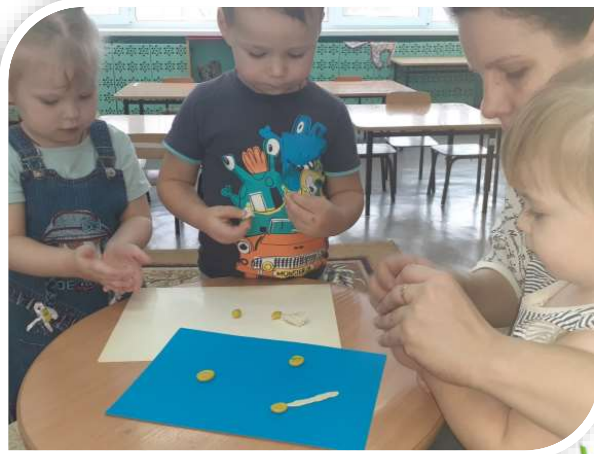
Совместная творческая деятельность по лепке «Ромашка белая»